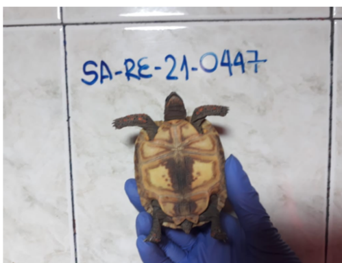
Fotos 4 y 5. Evaluación de un individuo vivo de tortuga morrocoy ( Chelonoidis carbonarius ) incautado mediante Acta 161225 e individualizado mediante Rótulo SA-RE-21-0447. Fecha 03/09/2021.